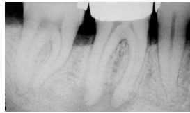
ENTZÜNDUNG AN DER WURZELSPITZE