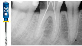
RÖNTGENMESS- AUFNAHME LÄNGENBESTIMMUNG